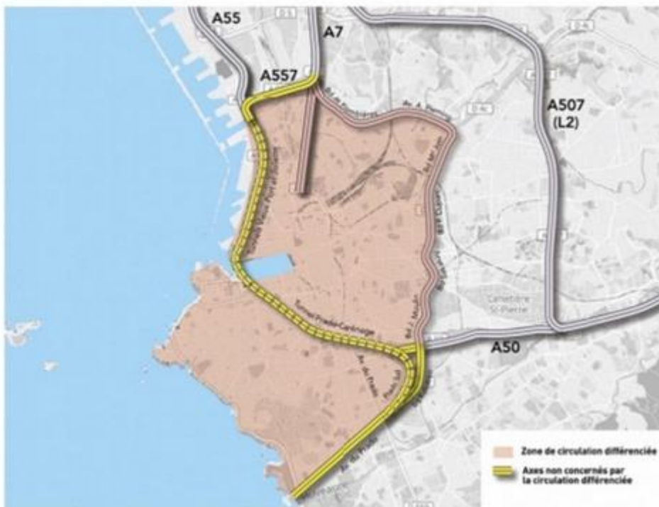
Périmètre délimitant la mise en œuvre de la circulation différenciée

Un périmètre de 19,5 km 2 a déjà été établi en 2018 et correspond à l'intérieur des boulevards de ceinture : Littoral – Euroméditerranée 1 et 2 – Lesseps – Plombières – Jarret – Rabatau – Prado. Sachez que la tolérance sera progressive en commençant par interdire les véhicules de catégorie 5 pour arriver à ceux de niveau 1 à l'horizon 2024